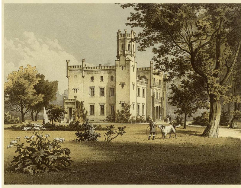
il. 1. Pałac w Naroku wg litografii A. Dunckera z poł. XIX w.