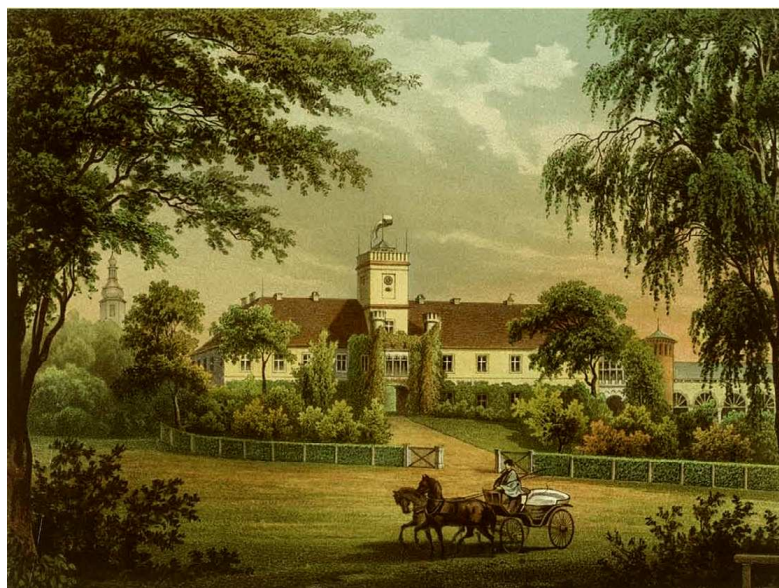
il. 3. Pałac w Dąbrowie wg litografii A. Dunckera z poł. XIX w.